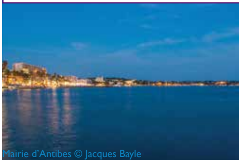
Mairie d'Antibes © Jacques Bayle