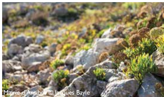
Mairie d'Antibes

Juan-les-Pins, from the Belle Epoque to the Roaring Twenties: Monday July 30 th at 9:30 am