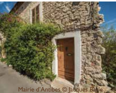
Mairie d'Antibes © Jacques Bayle

Visite guidée du Vieil Antibes en français : les 03/07, 09/07, 19/07, 24/07 et 31/07 à 9h30